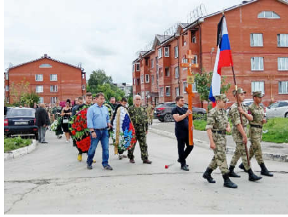
О. ЦАПЕНКО, фото автора, С. Семичастного и открытых источников.